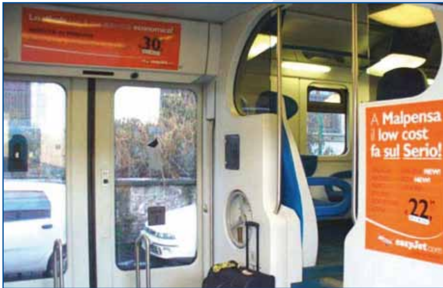
MANIFESTI cm 50x70 - n. 8