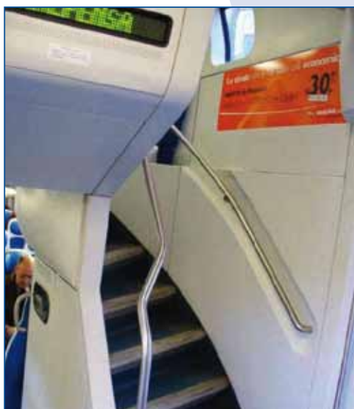
PANNELLO UPSTAIRS cm 110x35 - n. 8